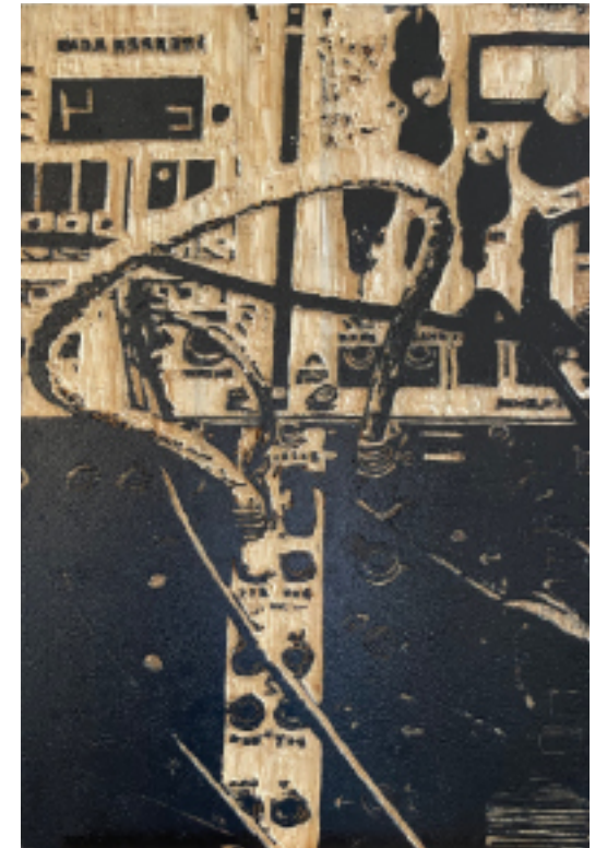
MICHAEL FALKENSTEIN MINIMAL SYNTHESIZER I (Druckstock) • 2017 Holzschnitt • ca. 97 x 65 cm

dm-arena – Halle 4 / Stand R03 paper:square – Halle 3