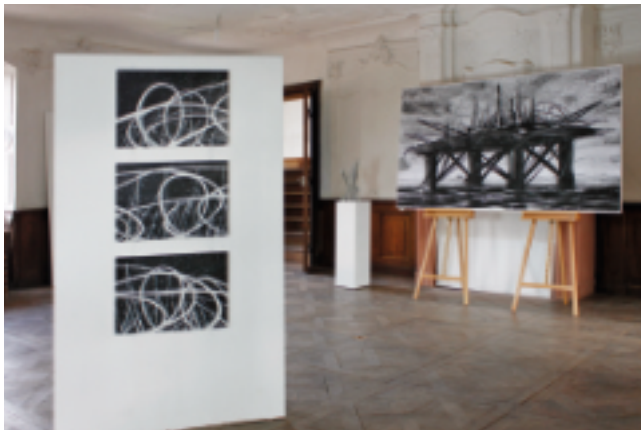
Einzelausstellung SPURENELEMENTE mit Werken von Constantin Jaxy · Detailansicht Hauptsaal Neues Archiv, Burg Wertheim