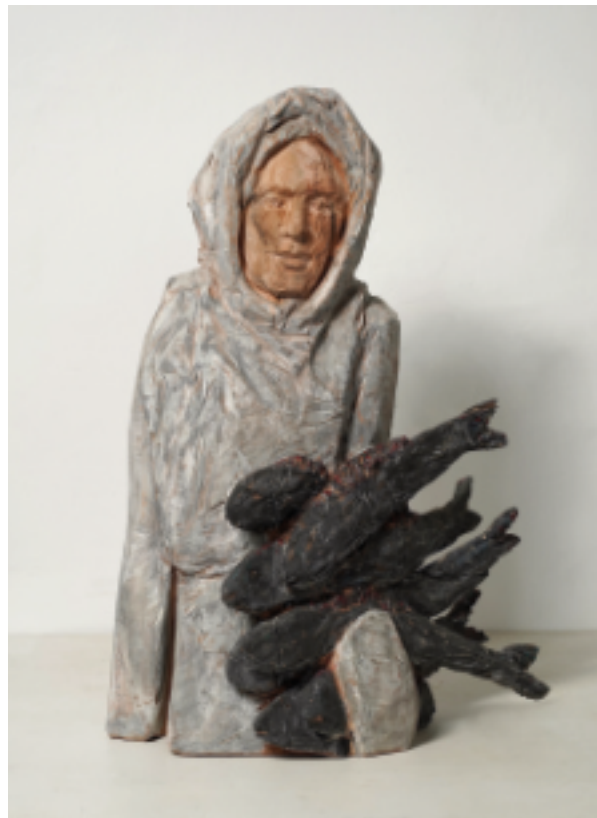
FISHING • 2024 Kirschbaum, farbig gefasst • 77 x 53 x 35 cm

Zahlreiche Einzelausstellungen, Ausstellungsbeiträge, Messeteilnahmen sowie Werke in privaten und öffentlichen Sammlungen in Deutschland.