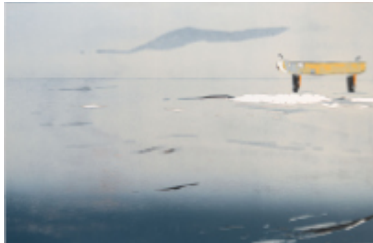
BRÜCKENTRÄGER • 2023 • Farbholzschnitt auf Büttenpapier • Auflage 2 von 5 • 70 x 100 cm

Zahlreiche Einzelausstellungen, Ausstellungsbeiträge, Messe- teilnahmen sowie Stipendien in den Niederlanden, in Dänemark, Deutschland, Finnland, Frankreich und der Ukraine.