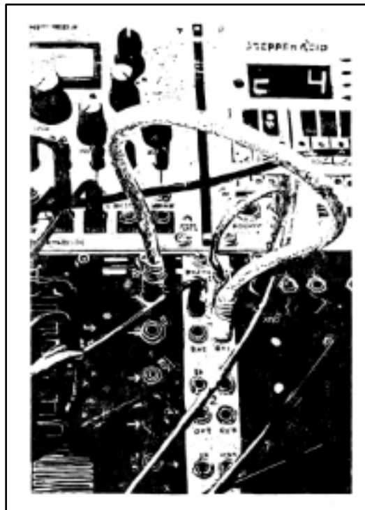
MINIMAL SYNTHESIZER I · 2017 · Holzschnitt auf Büttenpapier · Auflage 2 von 3 + e.a. · 110 x 80 cm

Zahlreiche Einzelausstellungen, Ausstellungsbeteiligungen, Messeteilnahmen sowie Werke in privaten und öffentlichen Sammlungen in Belgien, Chile, China, Deutschland, Finnland, Mexiko, Peru und Spanien.