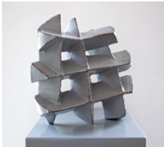
GITTER · 2002 Corten, Lackfarbe · ca. 33 x 33 x 20 cm

Zahlreiche Einzelausstellungen, Ausstellungsbeteiligungen, Messeteilnahmen und Kataloge sowie Werke in privaten und öffentlichen Sammlungen in Deutschland, Indonesien, Italien, Österreich, Spanien, den Niederlanden und der Schweiz.